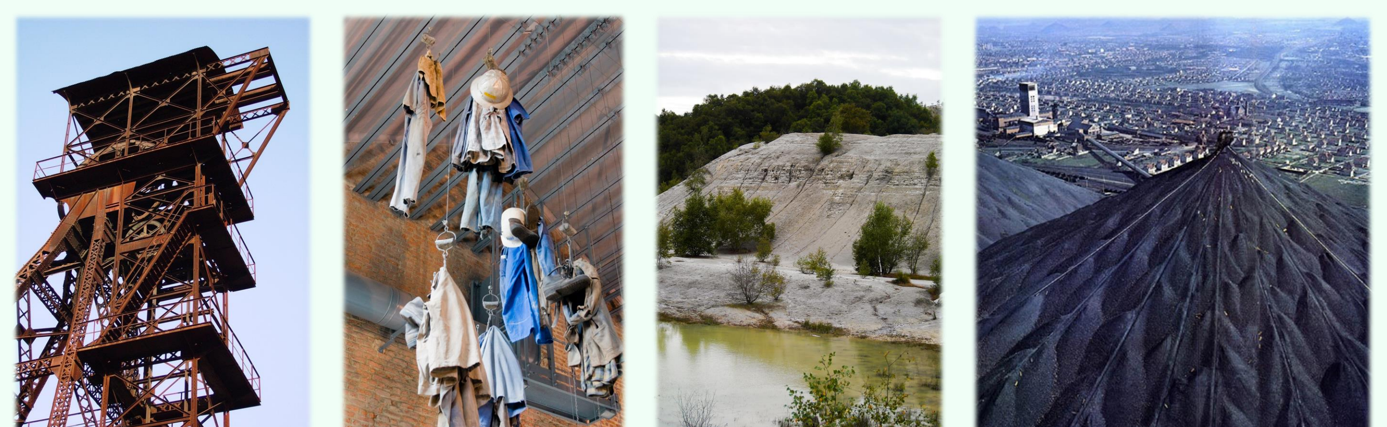
Illustration de gauche à droite : Chevalier au puits Distral Fontanks à Saint-Martin-de-Vaigues (Gard, 2009) ; Salle des Pénus, centre historique minier de Lewards (Nord-Pas-de-Calais, 2008) ; Dépôt de résidus miniers d'Abbaretz (Loire-Atlantique, 2014) ; Terrils charbonniers de Loos-en-Gohelle (Nord-Pas-de-Calais, 1963)

Etaient présents 11 représentants de : Rouez Environnement (Sarthe), Association pour la dépollution des Anciennes Mines de la Vieille Montagne (Gard), Association des riverains de Salsigne (Aude), Stop Mine 23 (Creuse), Douar Didoull (Côtes d'Armor) ; ainsi que des citoyens investis contre les permis d'exploration de Loc-Envel et de Merléac (Côtes d'Armor).