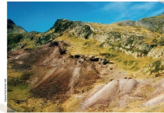
Mines de Chichoué