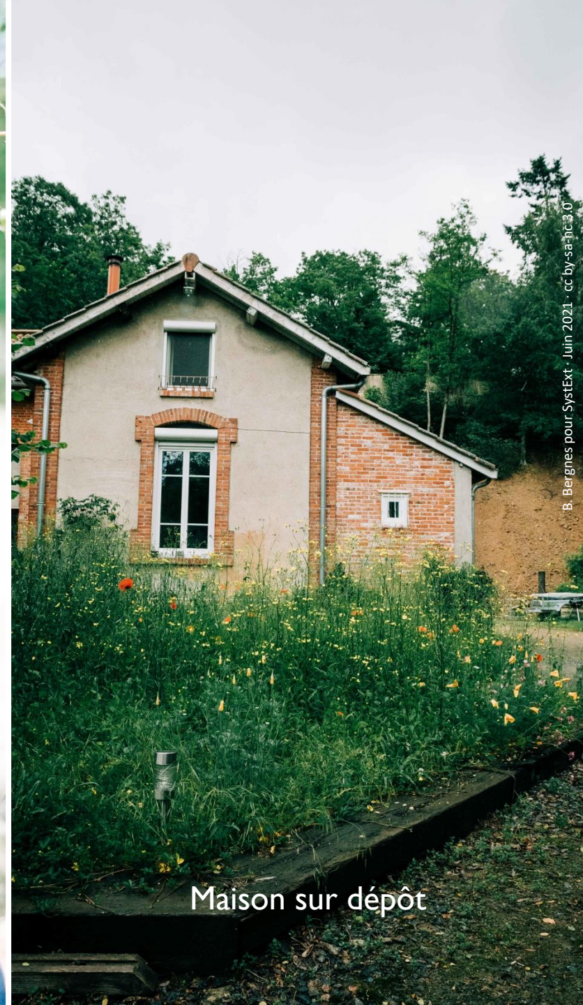
Maison sur dépôt