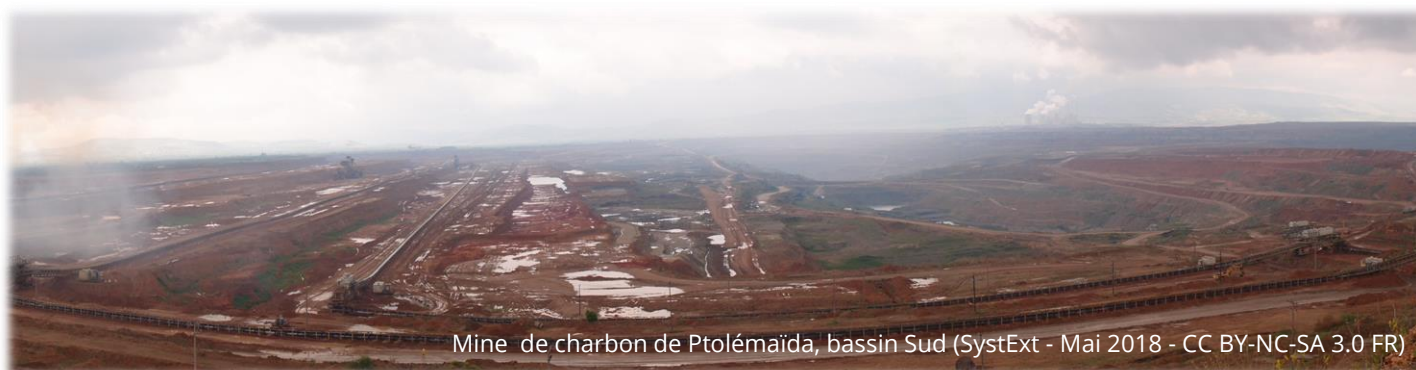
Mine de charbon de Ptolémaïda, bassin Sud