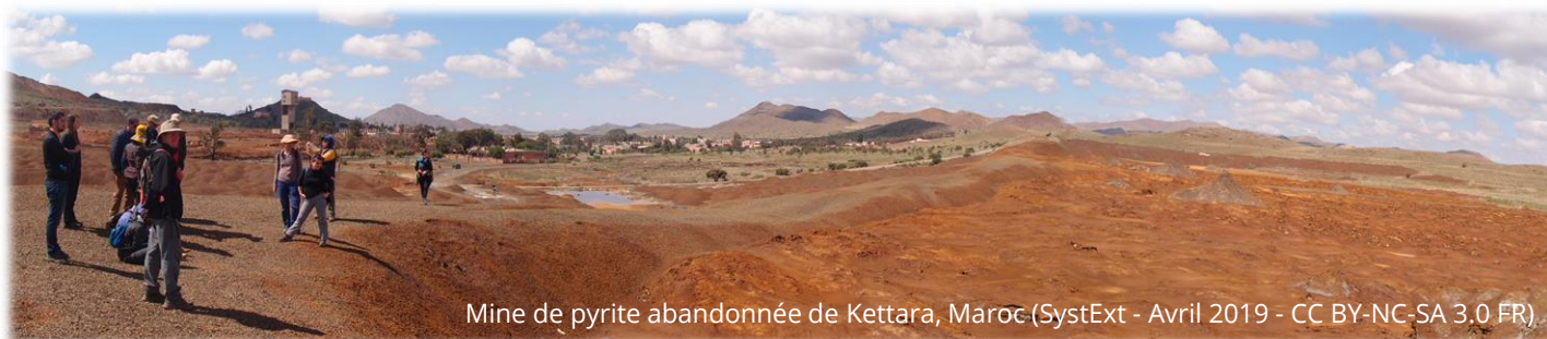
Mine de pyrite abandonnée de Kettara, Maroc