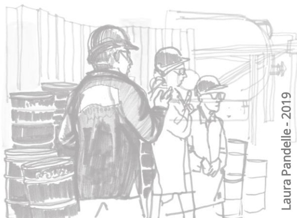
Laura Pandelle - 2019