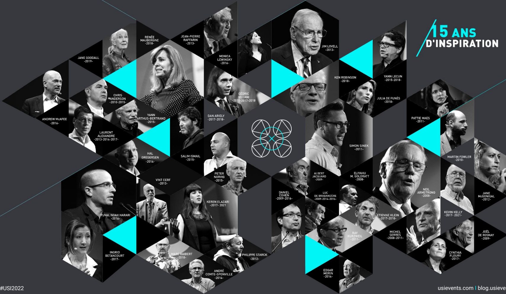
JANE GOODALL -2019-