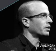
YUVAL NOAH HARARI -2016-