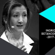
INGRID BETANCOURT -2017-